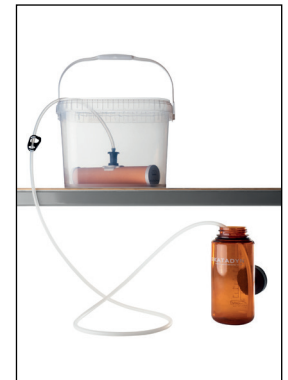
Eimer nicht enthalten